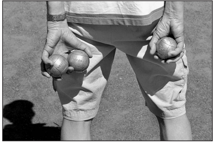
Erfolgreiches Turnier: Spiel und Spass bei richtiger südfranzösischer Sommerhitze mit Stahlkugeln auf dem Sportplatz.